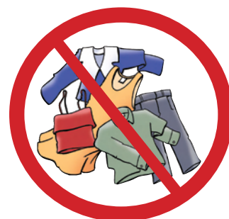
Tøj, dyner, lagner

Madrasser, madbakker, gulvtæpper og andet stort må ikke komme i skakten, da det sætter sig fast.