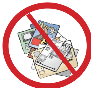
Aviser, reklamer, papir