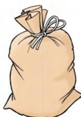
Max 11-liters poser