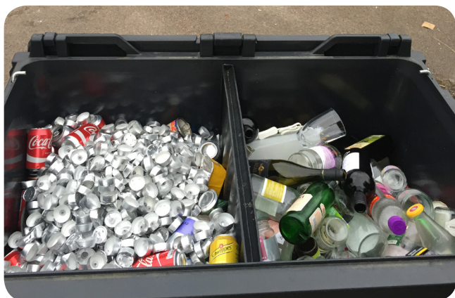
Meget metal og glas bliver indsamlet i forsøget.

Pizzabakker, mælke, yoghurt- og juicekartoner må ikke afleveres i papir & pap, men skal afleveres i restaffald .