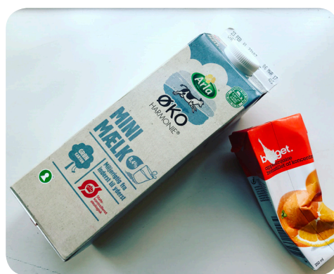
Mælke, yoghurt- og juicekartoner ligner pap, men består af pap og plastik, og kan derfor ikke genanvendes som pap - de skal afleveres i restaffald.