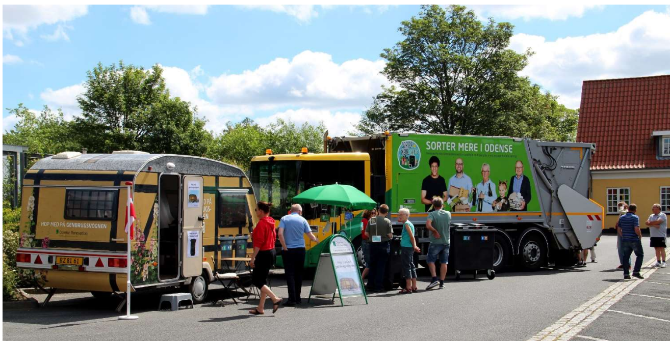
Borgere ser på 2-kammerskraldebil, info-campingvogn og nye beholdere ved åbent hus-arrangement på Snapindvej i juni 2019