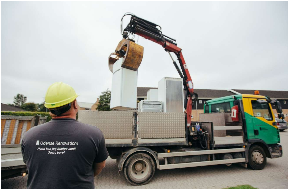
Storskralsbilen henter køleskabe, ovne og andet storskrald i Odense Kommune

P-nr. 1.009.076.162 Snapindvej 21 (Snapind) P-nr. 1.009.076.642 Holkebjergvej 60C (genbrugsafdelingen) Containeropbevaringsplads, P-nr. 1.010.649.419