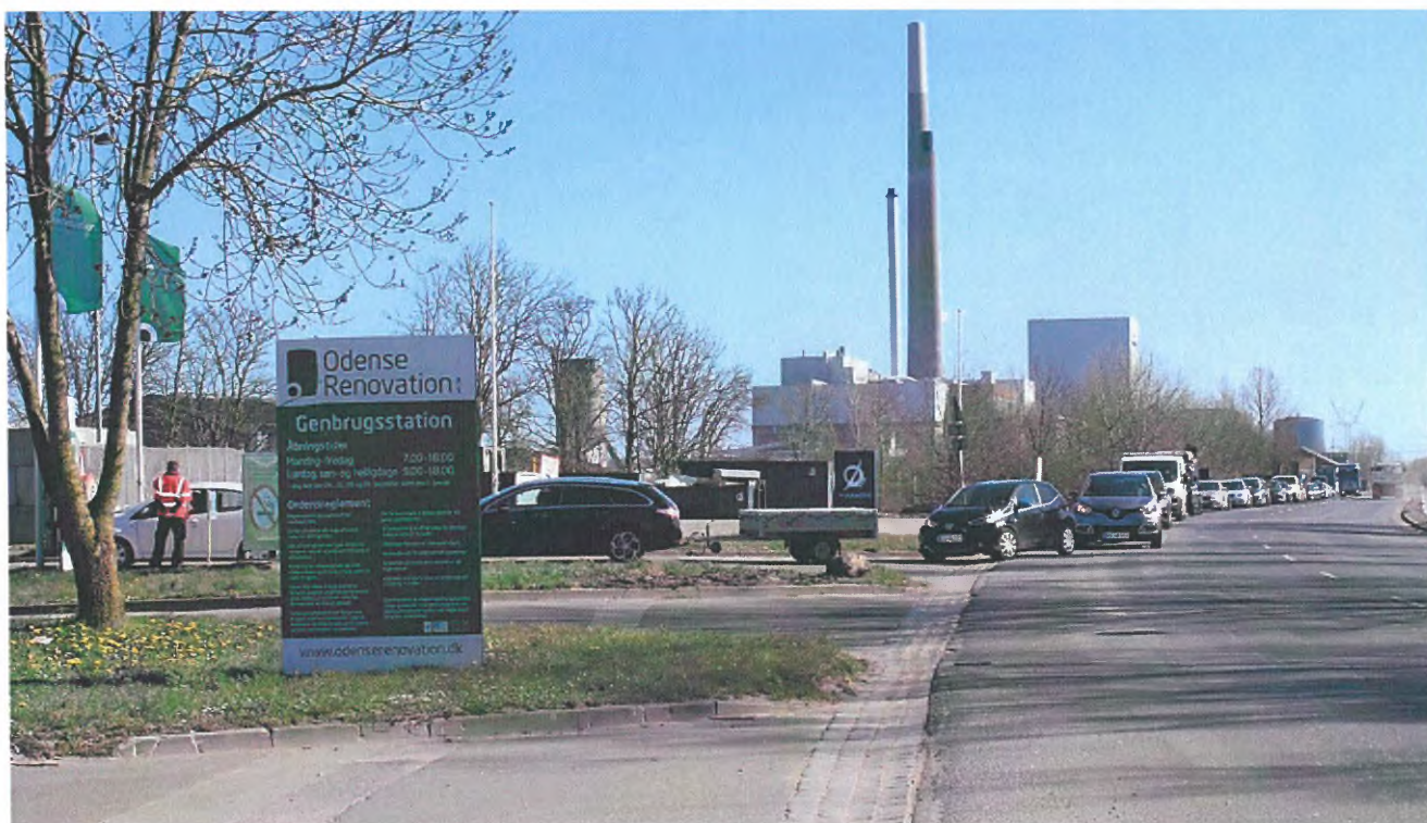
Mange biler i kø til genbrugsstationen i Havnegade, april 2020