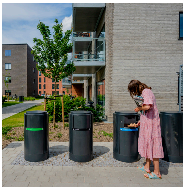
Affaldsindkast i Østerlunden