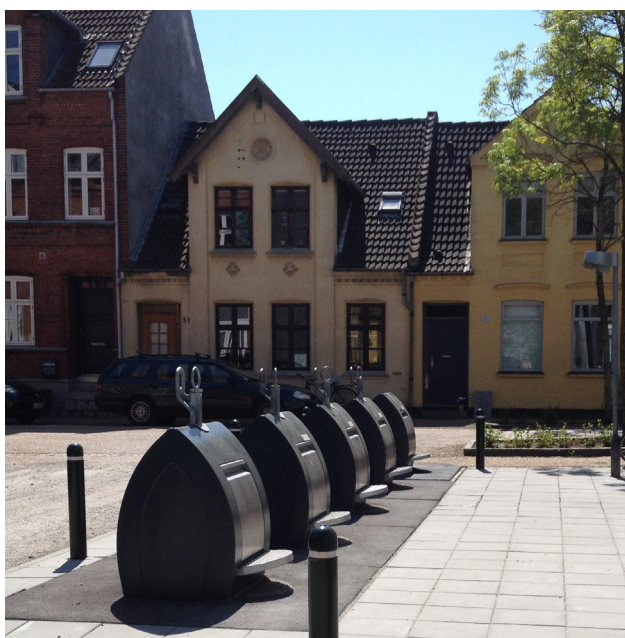
Eksempel på nedgravet affaldsløsning i Skt. Knuds Gade.